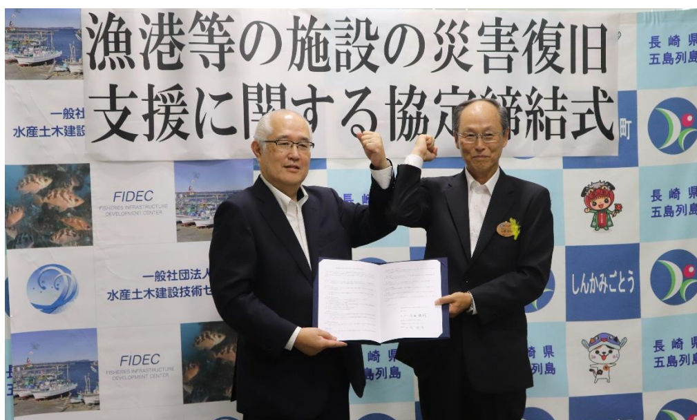
新上五島町との協定締結式

新上五島町の管理漁港である第2種漁港の小串漁港と17の第1種漁港の漁港施設等が自然災害で被災した場合、当センターが迅速に災害復旧事業の支援を行うものです。