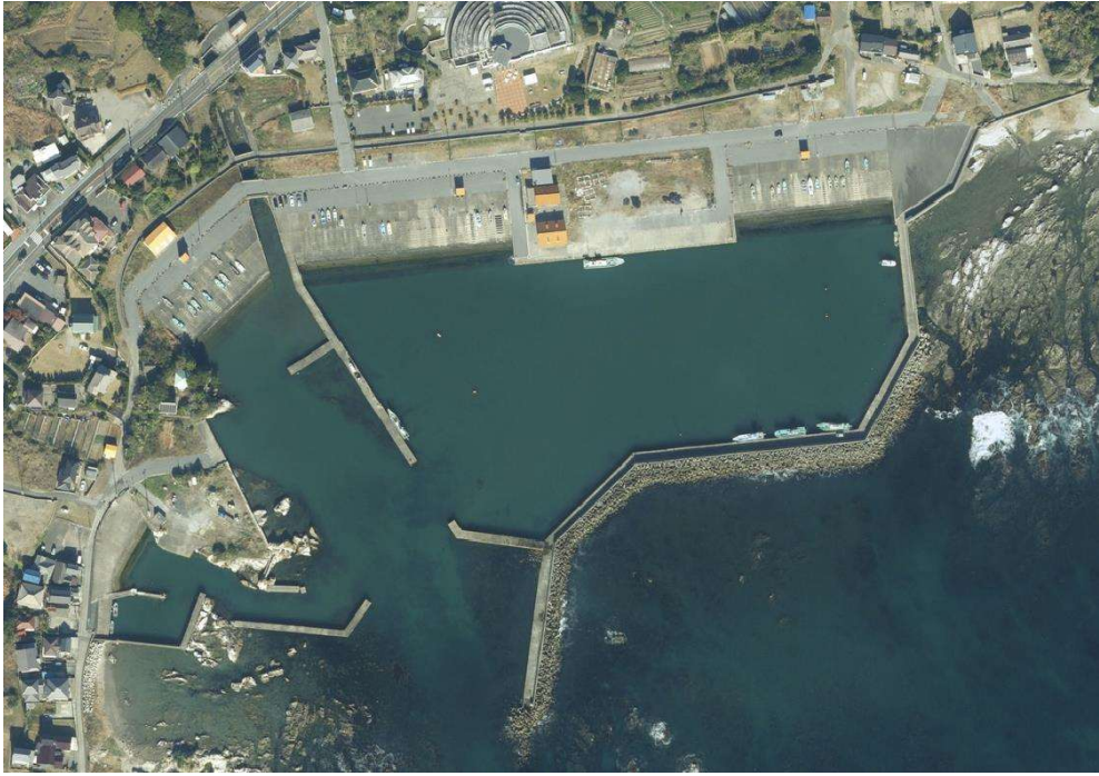
太夫崎漁港